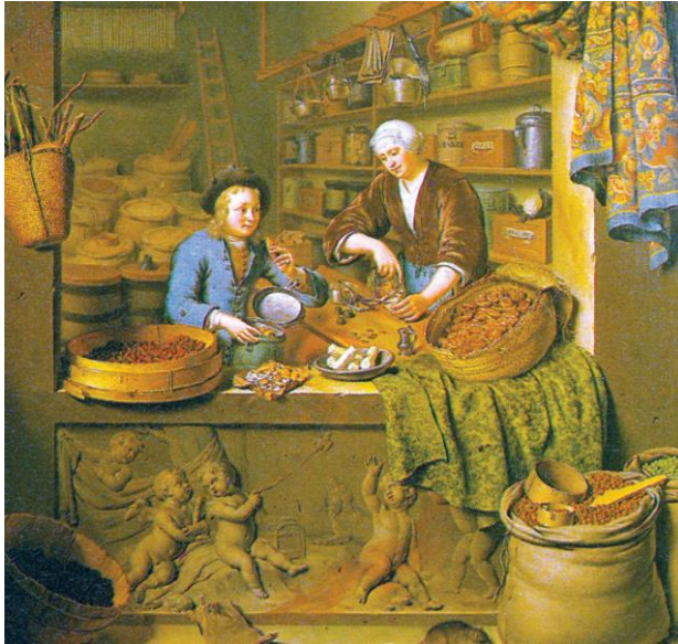
Bogato založena stojnica z začimbami v 17. stol.

Turki in Arabci so pretrgali trgovino z vzhodom, zato so evropski trgovci iskali nove poti po kopnem in morju. Evropa si je želela orientalsko blago (dobrine z vzhoda):