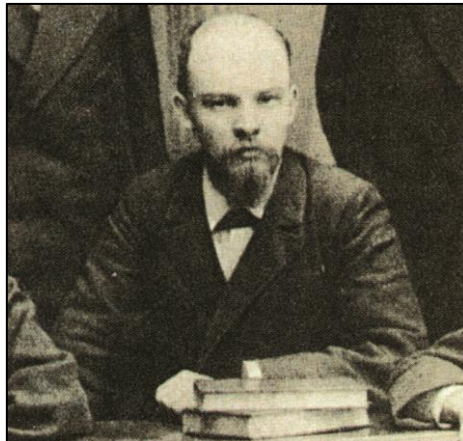
Vladimir Iljič Lenin – oče revolucije

“Oblast sovjetom! Zemljo kmetom! Mir ljudem!”