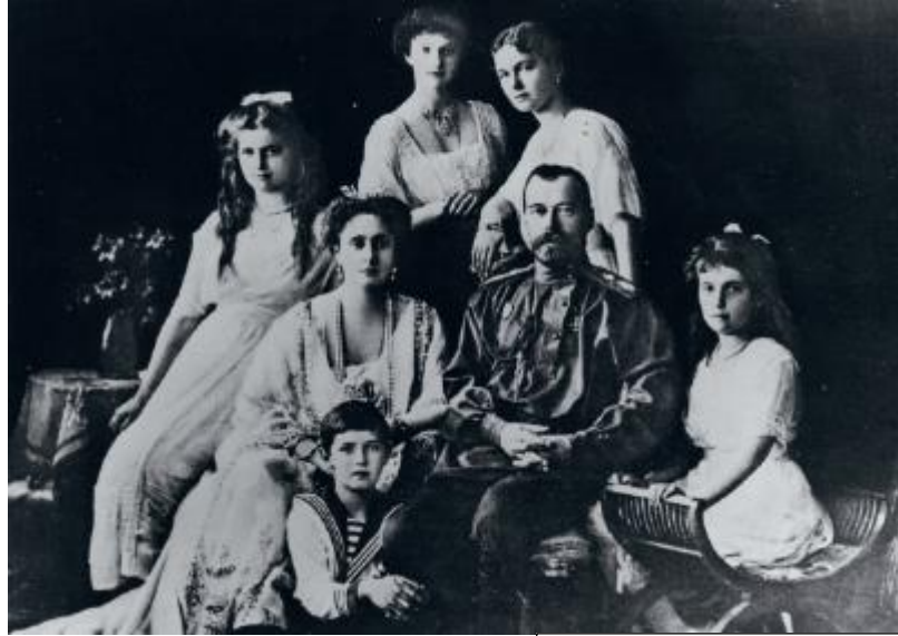
Car Nikolaj II. z družino