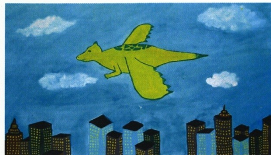
Iza Škufca, 7.b

(odlomek iz knjige Anton Dremelj Resnik: različica št. 2: Ad lintverna)