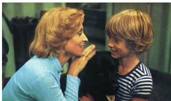
Sreča na vrhovi

Lahko pa se vsi skupaj udobno namestite in si ogledate kakšen otroški ali družinski film. Zakaj pa ne bi poslušali pravljice ali gledali risanke?