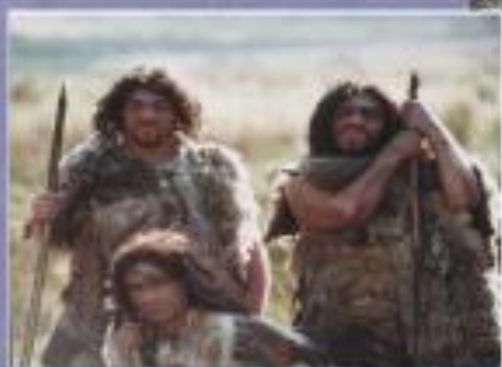
Človek iz kamene dobe