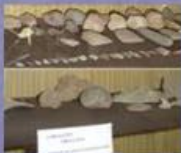
Orodje in orožje iz kamna