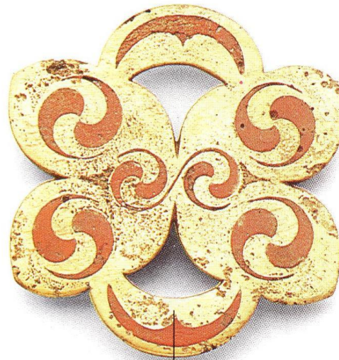
Okrasje s konjske oprave, najdeno v Norfolkku v Angliji

Ta bronasti obesek z emajliranimi okrasi iz saškega groba je malo mlajši od drugih predmetov na tej strani. Toda krivulje in krogi kažejo, da so ta umetniški slog v severni Evropi še naprej uporabljali.