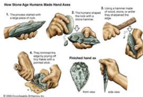
Izdelava kamnitega orodja