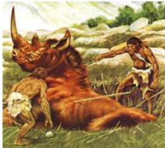
Ljudje so se preživljali z lovom in nabiralništvom