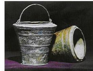
Posode iz dobe kovin, kjer so uporabljali prve kovine