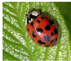
naseljevanje tujerodnih organizmov

Pri vsakem posegu v naravo je potrebno imeti v mislih njegove posledice. Tista območja, ki jih človek zaradi naravnih danosti ne sme spreminjati, so zavarovana.