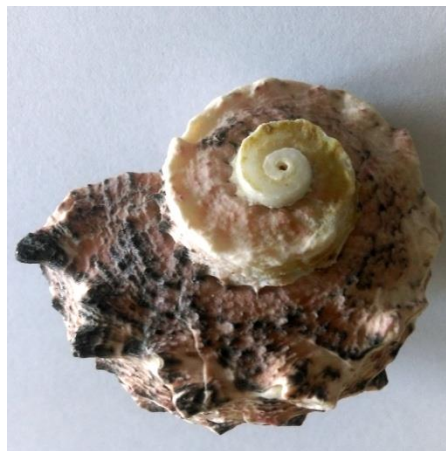
Školjka SIMETRIČNE ,