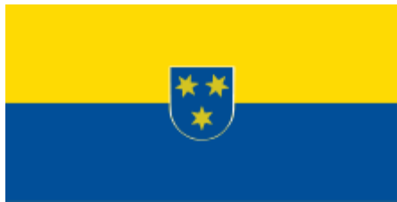
Zastava Mestne občine Celje

Zelo zanimive so tudi zastave različnih občin, tabornikov ipd.