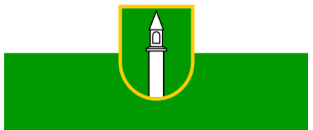
Zastava občine Ivančna Gorica