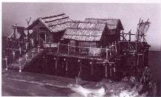
Mostiščarsko naselje na Ljubljanskem barju

Kolibe so bile lesene in ometane z ilovico.