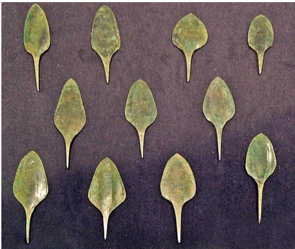
bakrene konice sulic