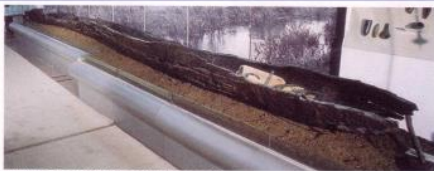
Drevak – čoln, s katerim so potovali po močvirju.

Ljudje so se ukvarjali s poljedelstvom, živinorejo in ribolovom.