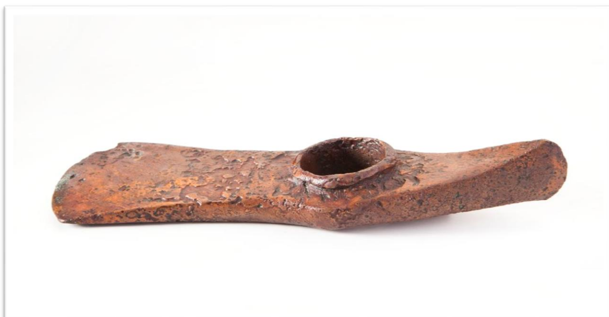
bakrena konica sekire