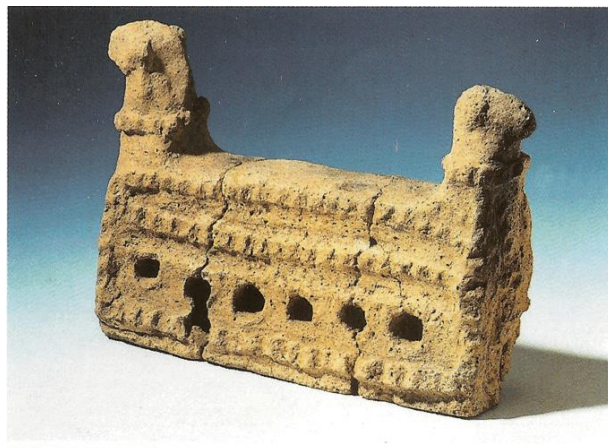
Glinen raženj z ovnovima glavama iz železnodobne hiše.