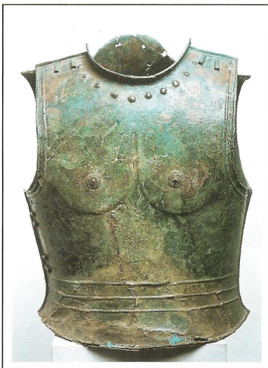
Bronzast oklep, sredina 7. stol. p.n.št..

Arheološke najdbe hrani Narodni muzej v Ljubljani.