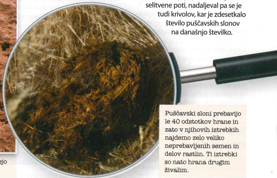
Puščavski sloni prebavijo le 40 odstotkov hrane in zato v njihovih iztrebkih najdemo zelo veliko neprebavljenih semen in delov rastlin. Ti iztrebki so nato hrana drugim živalim.