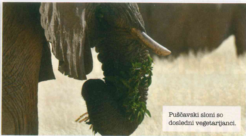
Puščavski sloni so dosledni vegetarijanci.

Čprav je Namib prava puščava, pa je pod njo shranjeno veliko podtalne vode. Še posebej veliko podtalnice je pod rečnimi strugami. In puščavski sloni vedo, kako priti do nje. S trobcom izkopljejo približno pol metra globoko luknjo v zelo mehak in suh pesek povsem suhe struge. Že čez nekaj minut začne pesek postajati vedno bolj vlažen in kmalu se kotanja začne polniti z vodo. Voda je na začetku povsem blatna in blatne vode sloni ne marajo. Počakajo še nekaj minut, da se voda zbistri. Z njo si sloni najprej dobro izperejo prašni trobec in nato začno piti. Ker pa potrebujejo za