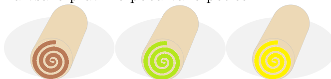
OREHOVA PEHTRANOVA LEŠNIKOVA