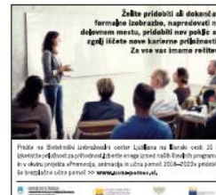
Priloga k dnevnemu časopisu 'Zlata leta' v sodelovanju s spletno stranjo www.zlataleta.si. Objavljeno 15. 5. 2019.