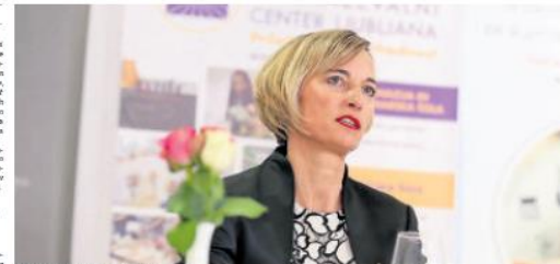
Mag. Jasna Kržin Stepišnik. © Shutterstock

Priloga k dnevnemu časopisu 'Zlata leta' v sodelovanju s spletno stranjo www.zlataleta.si. Objavljeno 15. 5. 2019.