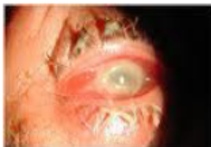
Močno vnetje – nujna pomoč

Endoftalmitis je vnetje osrednjega dela očesa, v glavnem steklovine, lahko pa zajame mrežnico, žilnico, roženico in prav vse notranje očesne strukture. Zgodnje odkrivanje in primerno zdravljenje sta pogoja za ohranitev vidne funkcije in očesa pri endoftalmitisu. V zadnjih 15. letih se je zdravljenje endoftalmitisa bistveno spremenilo.